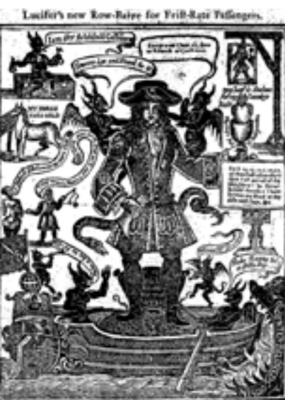
Mercurius Civicus Londons Intelligencer (London, England), August 11, 1643 - August 17, 1643