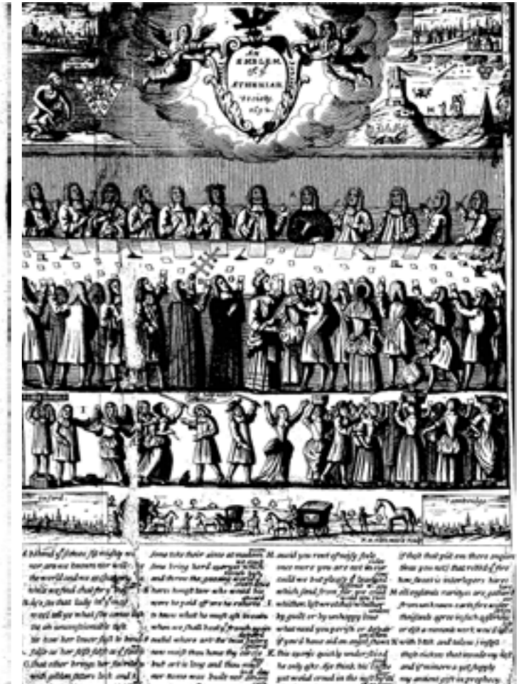
History of the Athenian Society (London, England), Tuesday, March 17, 1691

For information on the history of the Burney Newspapers Collection, visit gale.com/burneyinfo