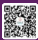
关注 Gale 官方微信