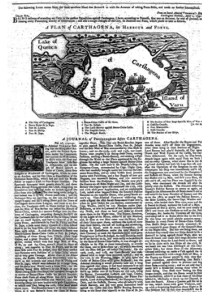
Daily Post (London, England), Thursday, June 4, 1741

查尔斯·伯尼与他的同代人约翰·尼克斯（John Nichols）都是最伟大的新闻出版物收藏家。他们二人的收藏构成了涵盖近代早期新闻出版物的最丰富、最综合全面的信息资源之一。“十七世纪和十八世纪尼克斯报纸典藏”也已由Gale出版。