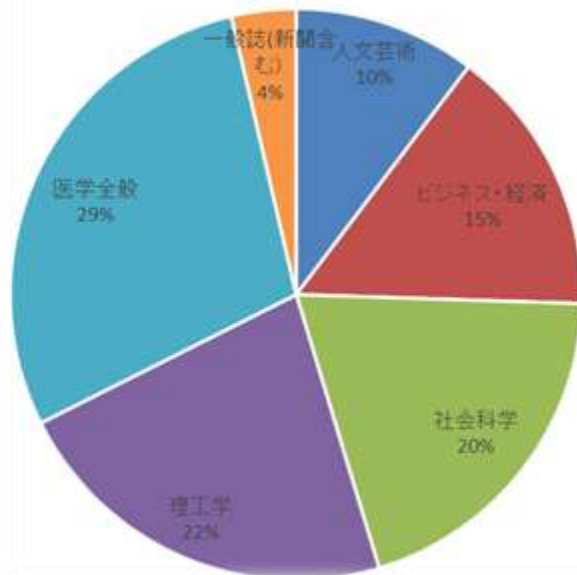
フルテキスト最新タイトル分野別